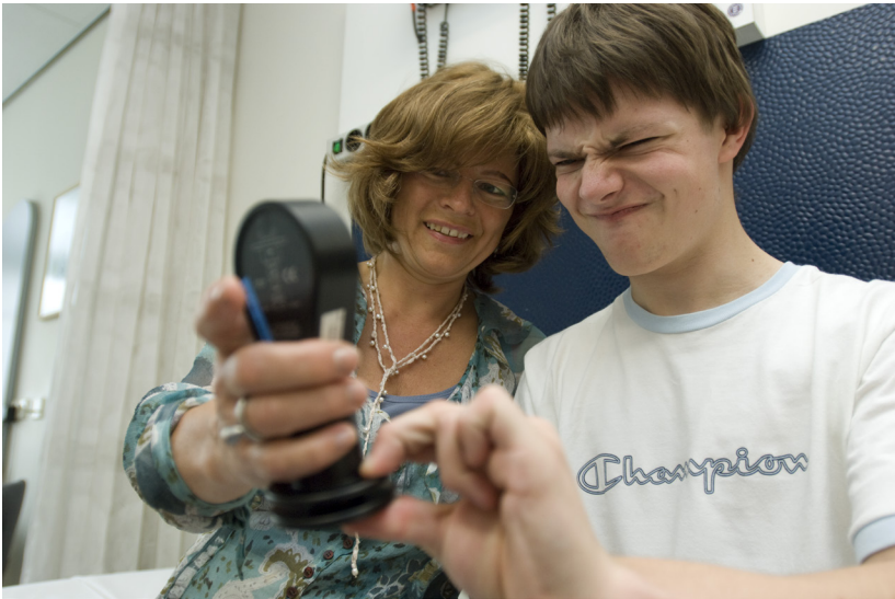
Krachtmeting van de handspieren